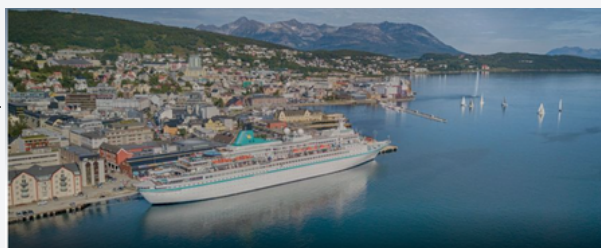
Harstad Cruise nettverk